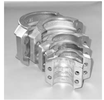
Klemmschale EN 14420-3 (DIN 2817)

ACCESSORIES Bolts EN ISO 4762 (DIN 912) 8.8 galv./1.4301 Nuts EN ISO 4032 (DIN 934) 8.8 galv./1.4301 are included