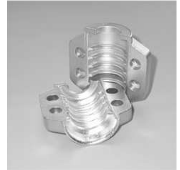
Klemmschale EN 14423 (DIN 2826)