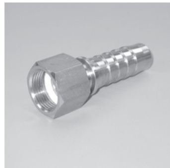
Mutterteil mit Bundstutzen