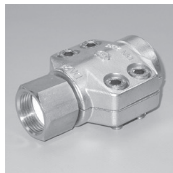
Mutterteil mit Klemmschalen

BETRIEBSDRUCK 100 bar für Komplett-Verschraubung EINBAND Klemmschalen 1.4410 schwere Ausführung EN 14423 TEMPERATUR +230° C