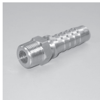
Vaterteil mit Bundstutzen