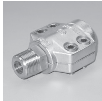
Vaterteil mit Klemmschalen