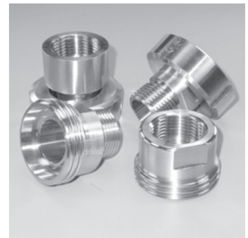
Einschraubstutzen - diverse