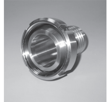
Kegel-Schlauchstutzen mit Nutmutter