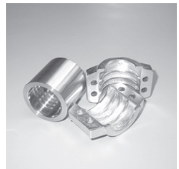
Einband Presshülse 1.4301 Klemmschalen 1.4401/3.2315