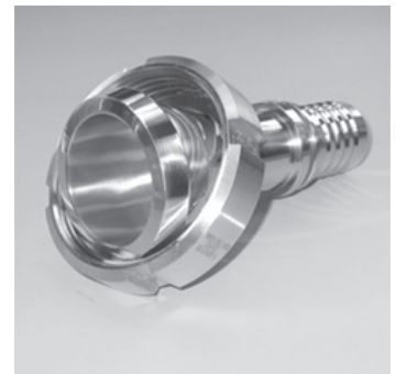
Kegelstutzen mit reduziertem Schlauchstutzen